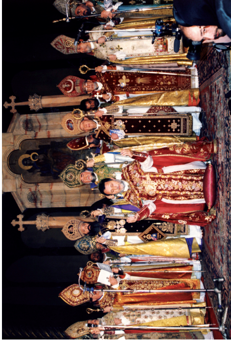
Ն. Ա. Օ. Տ. Տ. ԳԱՐԵԳԻՆ Բ. ԱՏԵՆՅԱՅՆ ՀԱՅՈՅ ԿԱԹՈՂԻԿՈՍ (1999) (Քսանեւելիինգերորդ տարեդարձ օծման եւ գահակալութեան)