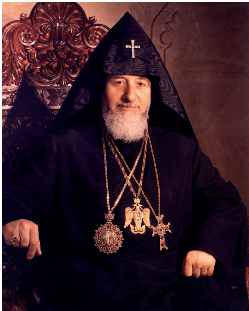
Տ. Տ. Վազգէն Ա. Ամենայն Հայոց Կաթողիկոսի վախճանման 30-րդ տարելիցը