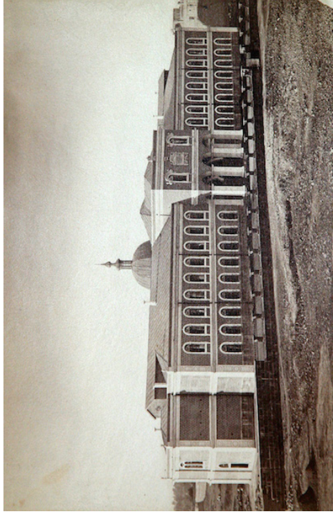
Գեւորգեան Յոգելոր Եւմարանի հիմնադրման 150 ամեակը