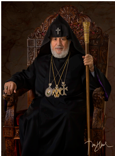
Ն. Ս. Օ. Տ. Տ. ԳԱՐԵԳԻՆ Բ. ՎԵՐԱՓԱՌԻ ԵՒ ՍՐԲԱԶՆԱԳՈՅՆ ԿԱԹՈՂԻԿՈՍ ԱՄԵՆԱՅՆ ՀԱՅՈՑ