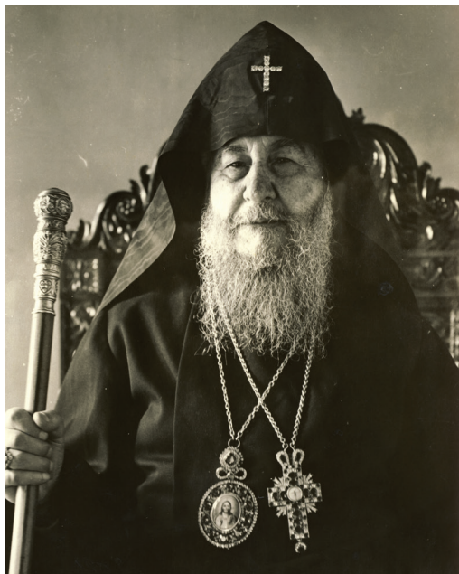
Տ. Տ. Գեորգ Զ. Ամենայն Հայոց Կաթողիկոսի վախճանման 70-րդ տարելիցը